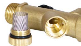
Filtro de malla integrado

JORC está certificado NEN - EN - ISO 9001:2015