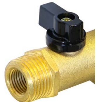
Entrada doble (1/2" & 1/4") para flexibilidad de instalación