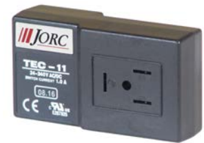
Etiquetado privado disponible