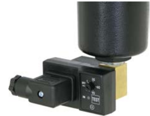
Diseño "In-line", ofreciendo fácil montaje bajo filtros