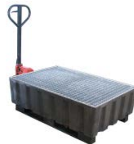
Fessure di presa per forche elevatore