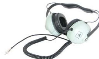
Fone de ouvido com capacete opcionalmente disponível