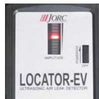
Indicação visual do vazamento