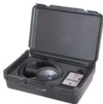
Fornecido em uma maleta com todos os acessórios