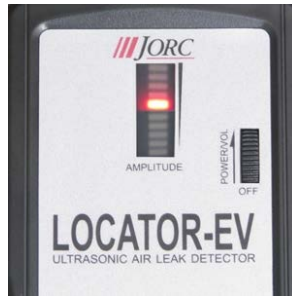
Görsel kaçak göstergesi