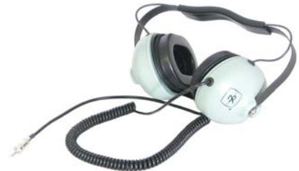
Sesli kaçak teyidi