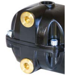
Kolay kurulum için uç giriş ağız