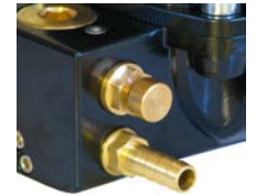
Rutin testler için TEST butonu