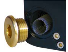
Valfi koruma amaçlı entegre süzgeç