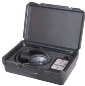
Fornito nella propria custodia con tutti gli accessori richiesti