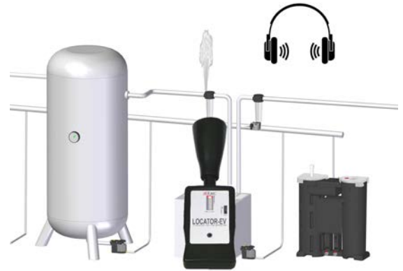
Visual and audible leak indication