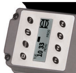
Встроенный кварцевый управляемый таймер с ЖК монитором