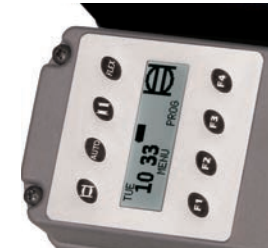
Temporizador de quartzo incorporado com display LCD