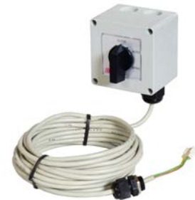
Opções de controle remote