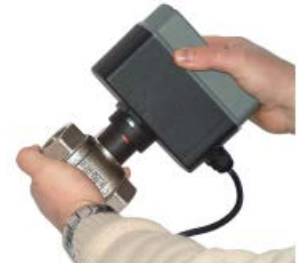
停電時の場合、手動開閉可能